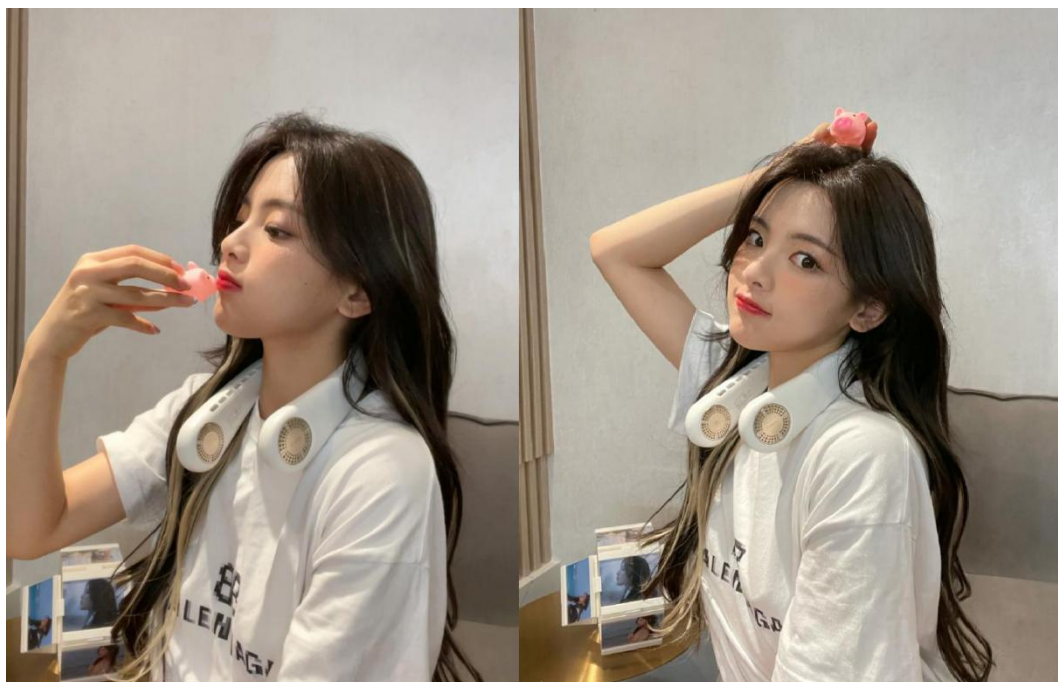
杨超越同款-图拉斯挂脖风扇