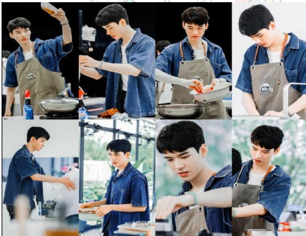
龚俊同款-锐舞驱蚊手环